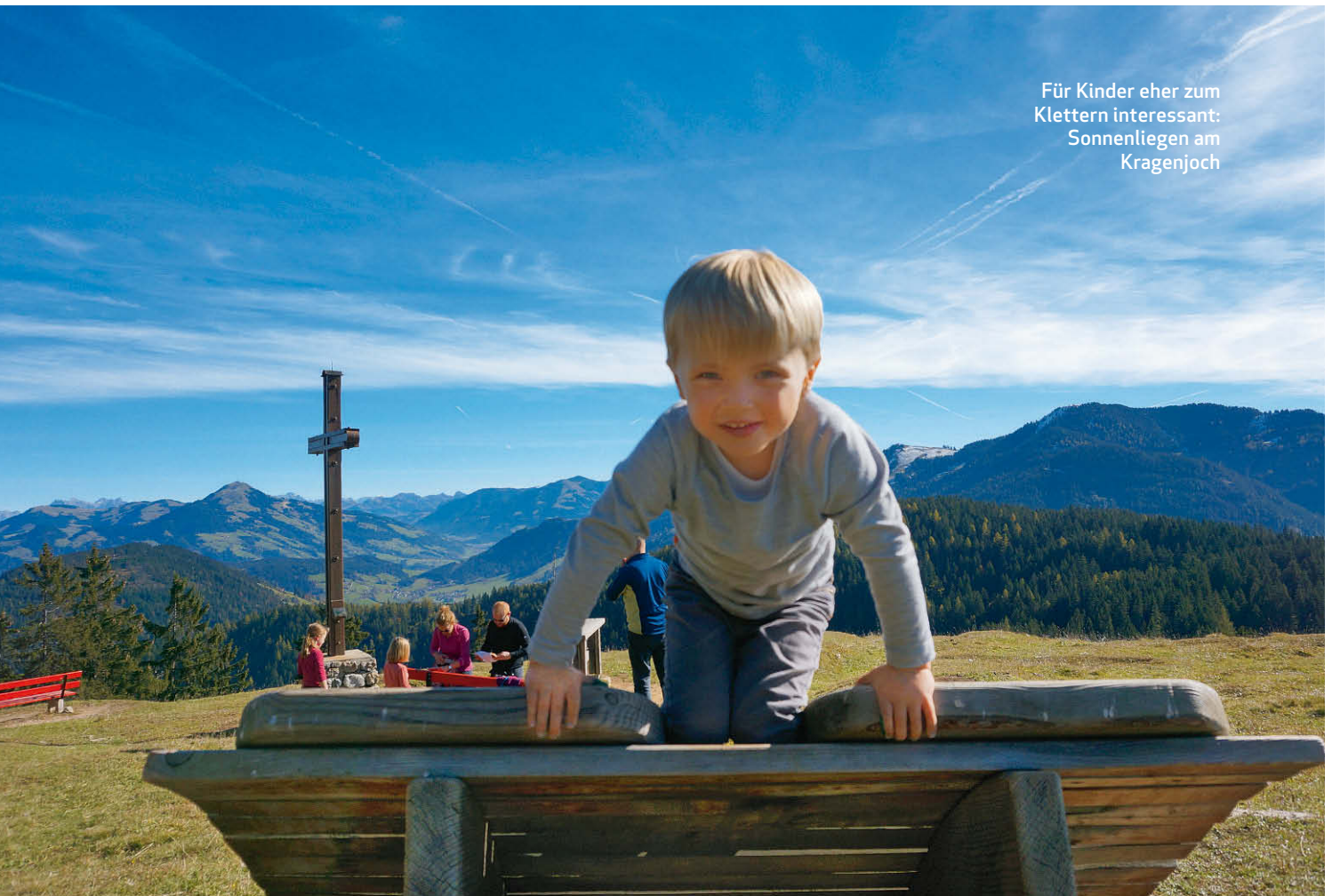
Für Kinder eher zum Klettern interessant: Sonnenliegen am Kragenjoch

bergab. Der Erwachsene kann sich ja indes auf der Sonnenliege langweilen und am ach so schönen Panorama satt sehen, welches Kinderaugen sträflich ignorieren. Es gibt diese Wandertouren, die sind für Familien perfekt: abwechslungsreich und spannend im Aufstieg für die Kinder, aussichtsreich für die Eltern und gesellig auf der Hütte für alle. Wie die Kragenjoch-Rundtour mit ihrer Kraxelei durch eine Steinrinne, einer Grotte im Fels, dem Gipfelplateau samt Blumen, Buckelwiese und Bergpanorama sowie der urigen Achen- talalm zum Schluss. ◀